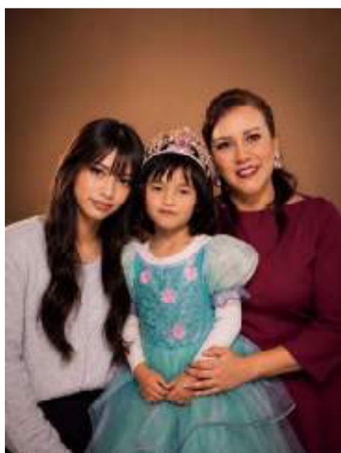
私と生きる希望たち（投稿者右）

Dayアリーズは、YICメンバーの思い出を積み重ねた日記のようなものです。日常で起こった面白いことや旅先での忘れられない場所、出会いなど、YICメンバーが心に残った写真とエピソードを紹介するコーナーです。