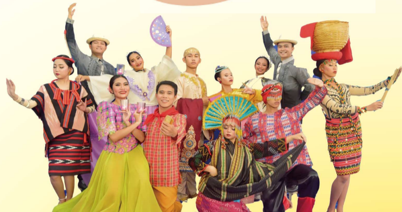
TUMANDOK DANCE COMPANY

セントラル・フィリピン大学に所属する学生で構成された民族舞踊団。大学が公認する唯一のダンスグループ。地元のパナイ州イロイロ市を含め国内外で公演を行い、伝統文化の継承に力を注いでいる。この度、民族舞踊やホームステイなどの異文化交流を通じた相互理解を目的に来市。