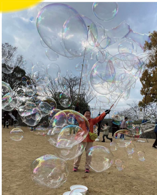
シャボン玉を満喫する母