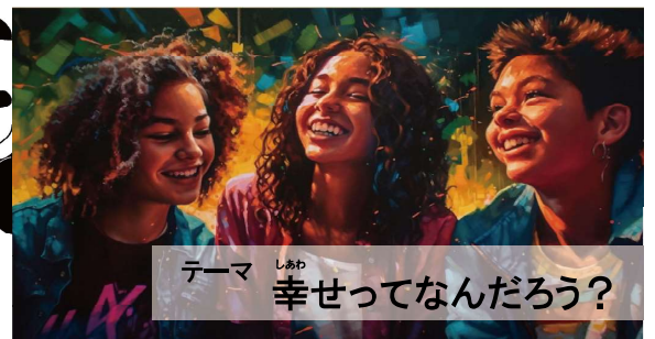
テーマ 幸せってなんだろう？