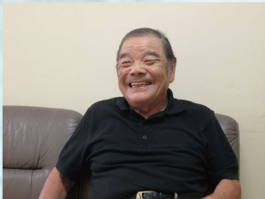
自身が運営するかしわ保育園にて。

30周年を迎えるYICを、少しでもみなさんに身近に感じていただけたらと、特別なコーナーを企画しました。第1回目は理事長のインタビューです。