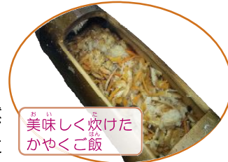
美味しく炊けたかやくご飯

八尾市大畑山青少年野外活動センターで、二日間に分けて行われたこのセミナー。今回のテーマは「竹の食器づくり」。のこぎりや小刀を使って、食事で使うお皿や箸、コップを作りました。みんな真剣かつ和やかな表情で、世界に一つしかないマイ食器づくりに挑戦していました。どちらの日も晴天に恵まれ、さまざまな自然体験活動を通して、参加者の心に自然の素晴らしさや温もりが深く刻まれたことと思います。特に、初めて経験する竹の伐採や予定にはなかったタケノコ掘り。そのタケノコをその場で焼いて食べた味は、忘れられない経験に。また、太い竹筒が炊飯器代わりになる不思議さや、炊けたかやくご飯の味もこれまた最高！そして自分で作った竹の食器で食べる時の充実感と満足感。どれをとってみても、自然と共生できた、一生忘れられない体験になったのではないのでしょうか。